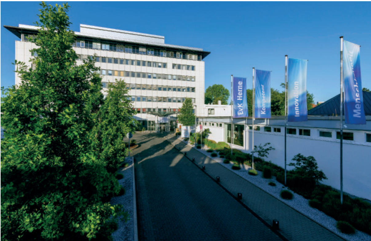
Das EvK Herne kann mit seiner Kardiologie eine hochspezialisierte Schwerpunktlinik vorweisen, zu deren Leistungsspektrum inzwischen auch Hochrisikoeingriffe direkt am Herzen gehören.

Bereits 2018 wurde die EvK-Kardiologie als erste auf Herne Stadtgebiet von der Deutschen Gesellschaft für Kardiologie mit einer Chest-Pain-Unit zertifiziert. Die Chest-Pain-Unit (CPU) steht 24 Stunden am Tag zur Verfügung. In insgesamt vier Monitorbetten werden Patientinnen und Patienten mit akuten Brustschmerzen zur Diagnosefindung wie im Sinne einer Intensivstation rund um die Uhr eingehend untersucht, überwacht und behandelt. Die Notfallstation verfügt über modernste und hochwertige Technik.