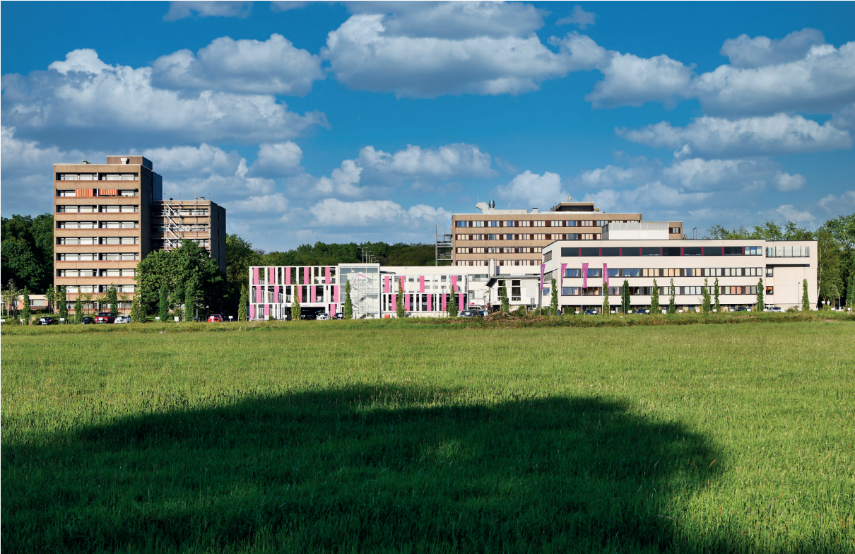
Der unverstellte Blick von der B 235 aus auf den Gebäudekomplex des EvK Castrop-Rauxel hat mittlerweile Nostalgiecharakter, denn auf der grünen Wiese an der Grutholzallee entsteht in unmittelbarer Nachbarschaft zum EvK der neue Gesundheitscampus.

oder Kraftlosigkeit. Im Unterschied zu anderen medizinischen Angeboten spielt bei der palliativen Versorgung außerdem die psychische und die seelische Verfassung der Patienten eine wichtige Rolle. Deshalb ist es Teil des Konzepts, Angehörige und Freunde in die Behandlung einzubeziehen.